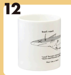
12 name “need” “don't need” #海環境・絶命危惧種 #マグカップ