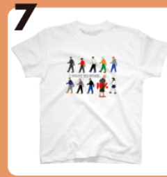
7 name ここで働かせて ください!Tシャツ #貧困問題 #Tシャツ