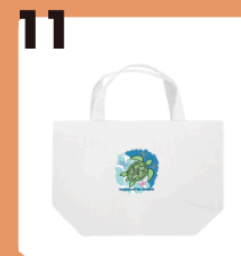
11 name Keyman of the shadow #ウミガメの減少 #トートバック