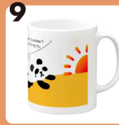
9 name ☆はらぺこぱんDA☆ #地球温暖化・絶命危惧種 #マグカップ