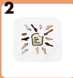
2 name hand chief #ウクライナ難民 #ハンカチ