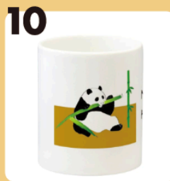
10 name 家に帰りたいパンダ #森林伐採・絶命危惧種 #マグカップ