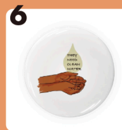
6 name NEED CLEAN WATER #水の衛生問題 #缶バッジ