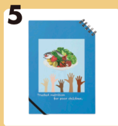
5 name 子どもを救うノート #こどもの貧困 #ノート