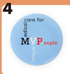
4 name 様々な人々に医療を! #平等な医療 #缶バッジ