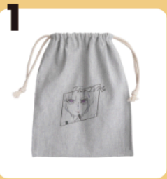
1 name This Is Me #ジャンダー問題 #きんちゃく