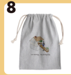
8 name Let me go to school #こどもの教育不足 #きんちゃく