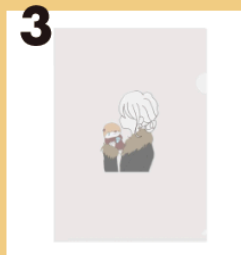
3 name おしゃれの裏側 #ラッコの乱獲 #クリアファイル