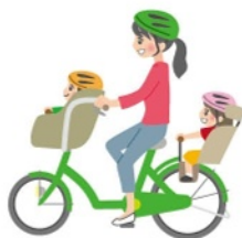
幼児二人同乗用自転車